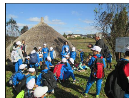
飯野小学校フィールドワーク (白山遺跡)