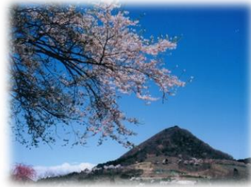
地区のシンボル千貫森