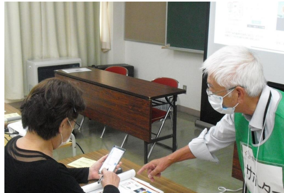
▲シニアICTサポーター活動の様子

※現在、令和3年度に本講座を受講した5名の方が市主催のスマホ講座のサポーターとして活動(有償ボランティア)