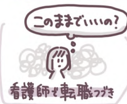
このままでいいの? 看護師と転職ワタシ