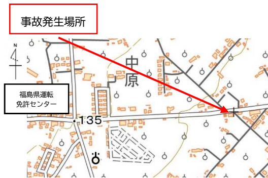
事故発生状況【平面図】