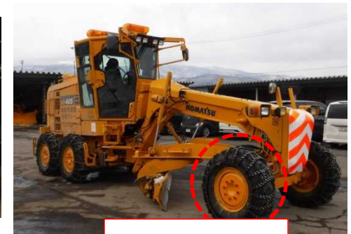
右側前方タイヤが 接触したが、損傷なし