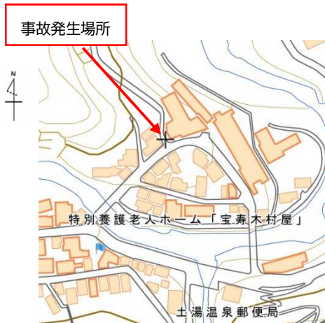
事故発生場所【位置図】