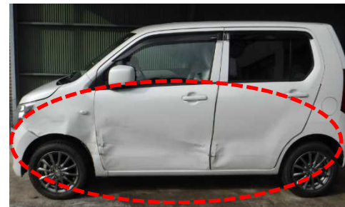
左側面を中心に 広範囲の破損