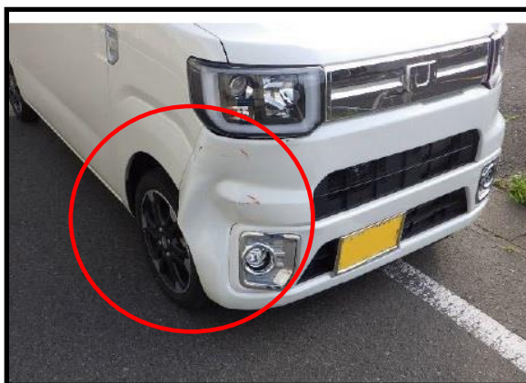
相手方車両破損状況