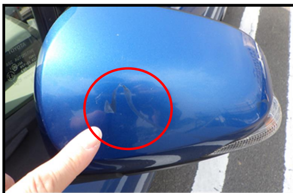
相手方車両破損状況