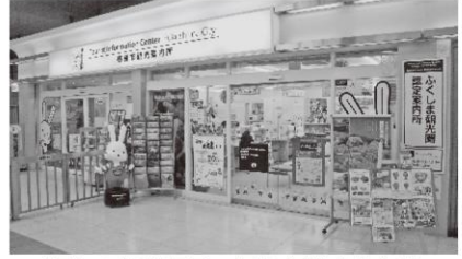
現在の福島駅西口福島市観光案内所

うち、一般会計補正予算(観光コンベンション協会組織運営補助金)については、本市のみならず、県北地域、山形、宮城のおもてなし最前線基地である福島駅西口福島市観光案内所の機能強化のためのリニューアルを行い、今春の花観光シーズン前までに観光客の受け入れ環境の整備を図るものであり、東京オリンピック・ソフトボール競技の一部開催による国内外からの誘客促進やリピーター創出、交流人口の拡大に向けた事業を実施する旨の説明がありました。