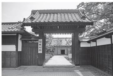
復元された旧堀切邸と周辺の町並み (ふくしま市景観100選より)