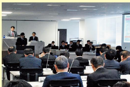
全員協議会の様子

また、公共施設の再編整備に係る財政試算について、コストを比較するなど市民にわかりやすく示すべきなど、構想の実現に向け、活発な議論が交わされました。