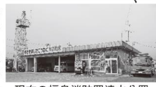
現在の福島消防署清水分署

うち、一般会計補正予算(福島消防署清水分署整備事業費)については、築42年を経過したことによる老朽化や新耐震基準を満たしていないことから、清水地区の防災拠点施設として、現在地に再整備を行うための基本実施設計を行う旨の説明がありました。