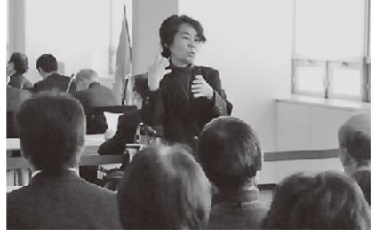
12月定例会議の手話通訳の様子

また、福島市手話言語条例制定の件については、手話は、手指や体の動き、表情などを使って、概念や意思を視覚的に表現する言語であるとの認識に基づき、手話に関する基本理念を定め、全ての市民が共に生きる地域社会の実現を目的として、手話に対する市民の理解を促進し、手話の普及および手話を使用しやすい環境を整備するため、