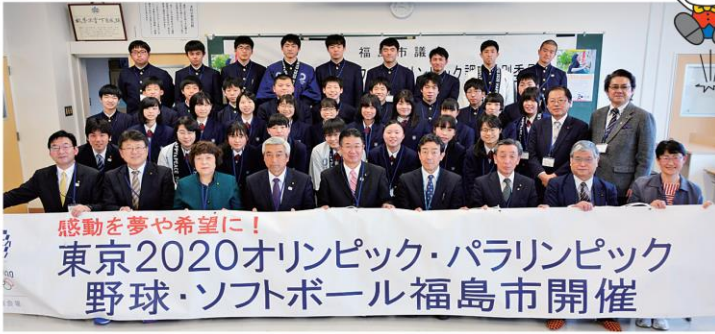
感動を夢や希望に！ 東京2020オリンピック・パラリンピック 野球・ソフトボール福島市開催