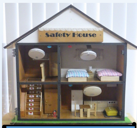
署員手作りによるモデルハウス

事前に住宅用火災警報器をご準備していただければ、無料で消防職員が、ご自宅まで取り付けに伺います。