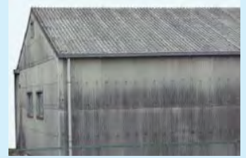
(石綿含有スレート)