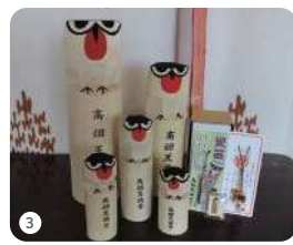
(極小サイズ～特大サイズ)