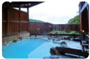
高湯温泉観光協会内には共同浴場「あったか湯」がある。