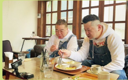
「出川哲朗の充電させてもらえませんか」