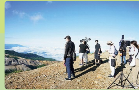
映画「浜の朝日の嘘つきども」(2021年公開)