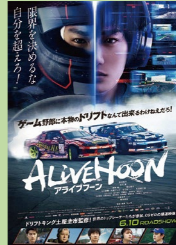
映画「ALIVE HOON (アライブフーン)」(2022年公開) 監督/下山天 主演/野村周平 ©「アライブフーン」製作委員会