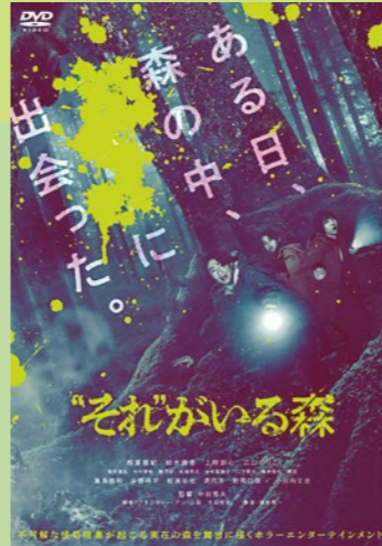
映画「“それ”がいる森」(2022年公開) 監督/中田秀夫 主演/相葉雅紀 ©2022「“それ”がいる森」製作委員会