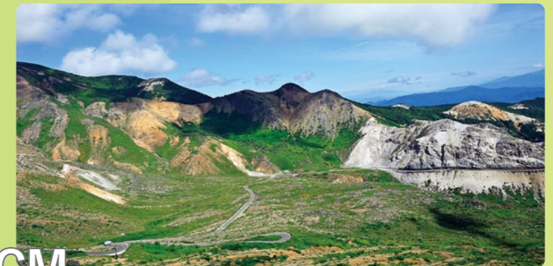
磐梯吾妻スカイライン