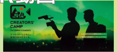
Sony CREATORS' CAMP