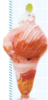
まるせい果樹園のももパフェ