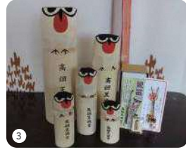
(極小サイズ～特大サイズ)