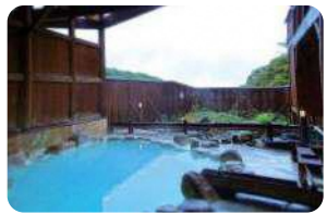
高湯温泉観光協会内には共同浴場「あったか湯」がある。