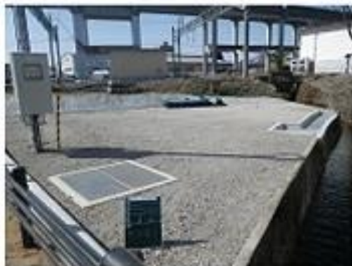
碓川の 雨水貯留施設の整備▶