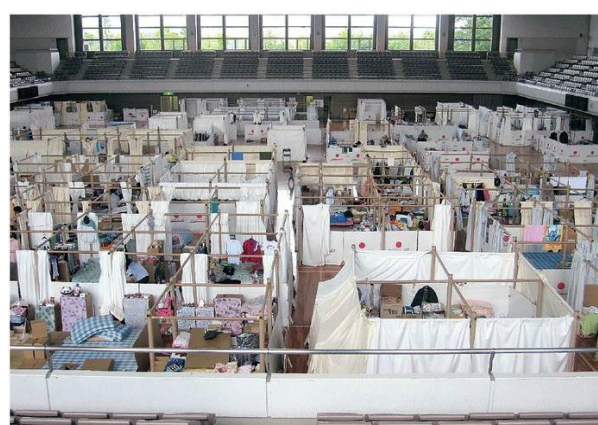
H23. 6. 8