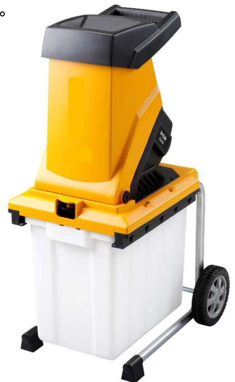
家庭用剪定枝 破碎機（イメージ）

貸出を希望する日が決まりましたら、貸出希望日の前月の初日から2日前（土日祝日は含みません）までに、ごみ減量推進課に電話、または、オンライン申請でご予約ください。