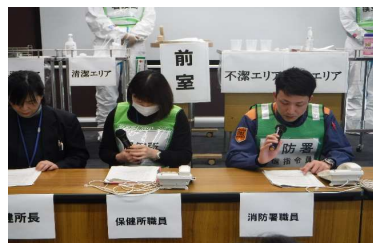
消防と保健所の連絡、連携の場面