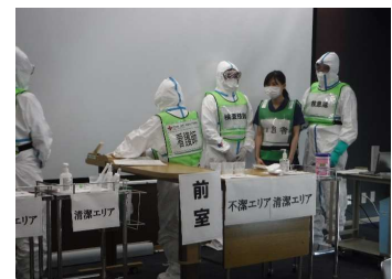
患者受入対応の場面