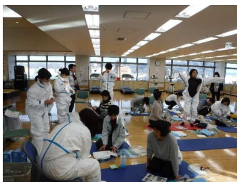
個人防護服着脱訓練の様子