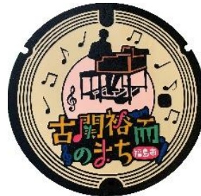
【デザインマンホール】