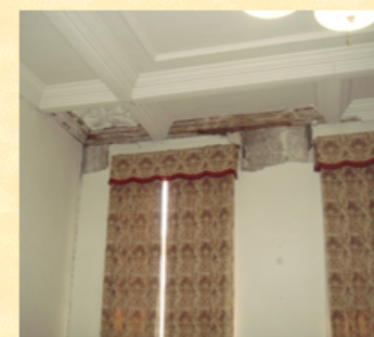
(震災により被災した写真美術館)