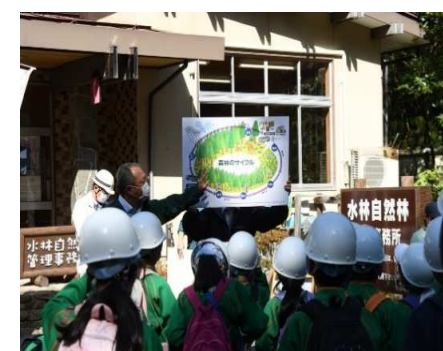
森林学習(イメージ)