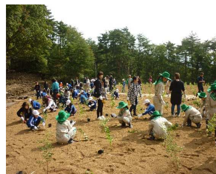
植樹体験(イメージ)