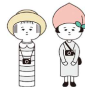
ちょうどいい旅、ふくしまステイ。

本市では、令和5年1月10日に再開する全国旅行支援に先立ち、本市の観光閑散期となる冬季の観光周遊の促進と観光消費の引き上げを図るために、QRコードを活用したデジタルラリーを実施します。