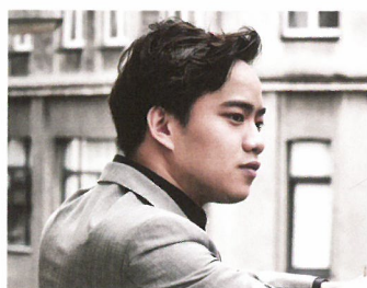
グエン・ヴィエット・チュン (ピアノ)

1984年生まれ。今ベトナムで最も注目を集める音楽家。作曲家としても頭角を現しており、これまで国内外の芸術文化交流の為に多くのクラシック音楽や民族音楽を作曲、編曲。また、日本・香港・中国の音楽家たちと共に、ハノイで多くの国際文化交流事業を開催しており、国内の音楽業界では、ベトナムと世界の音楽をつなぐ「メッセンジャー」と呼ばれています。