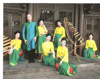
スック・ソン・モイ竹楽 アンサンブル

日・ベトナム外交関係樹立50周年を記念し結成された期間限定のドリームオーケストラ。ベトナム国立オペラ・バレエ交響楽団、サンシンフォニー、ホーチミン市立オペラ・バレエ交響楽団、東京フィル、新日本フィル、仙台フィル、読売交響楽団、日本フィル、群響、九響等より、日本とベトナムを代表する名プレイヤーが集結。