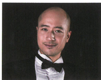
ドン・クアン・ヴィン (指揮)

1984年生まれ。今ベトナムで最も注目を集める音楽家。作曲家としても頭角を現しており、これまで国内外の芸術文化交流の為に多くのクラシック音楽や民族音楽を作曲、編曲。また、日本・香港・中国の音楽家たちと共に、ハノイで多くの国際文化交流事業を開催しており、国内の音楽業界では、ベトナムと世界の音楽をつなぐ「メッセンジャー」と呼ばれています。