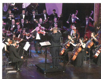
日越祝祭管弦楽団 (管弦楽)

1996年ベトナム・ハノイ生まれ。2020年ポーランド州立音楽大学ビドゴシュチュ音楽院を卒業。数多くの国際ピアノコンクールで入賞を果たし、直近では、2021年に開催された「ショパン国際ピアノコンクール」で、東洋人として初めてショパン国際ピアノコンクールで優勝したダン・タイ・ソン以来、40年ぶりにベトナム人として決勝戦にエントリーされ、その繊細なピアノリズムが大きな反響を呼びました。