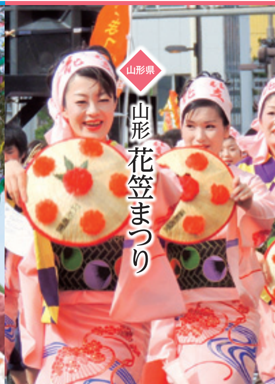
山形県 山形花笠まつり