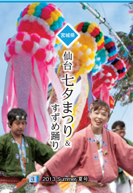
宮城県 仙台七夕まつり & すずめ踊り