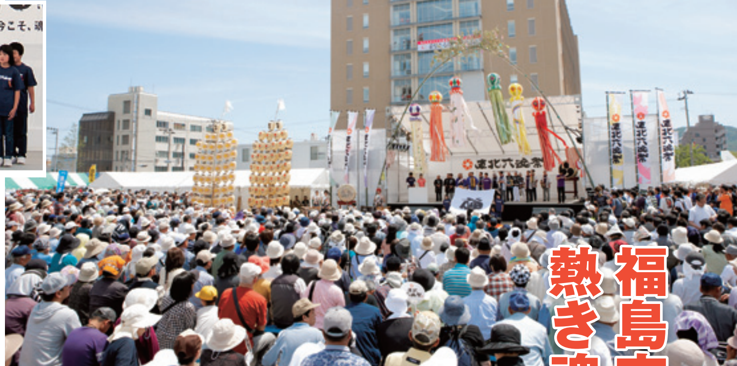
メイン広場では多くの来場者を集め開祭式が行われ、東北六魂祭の開祭を宣言しました