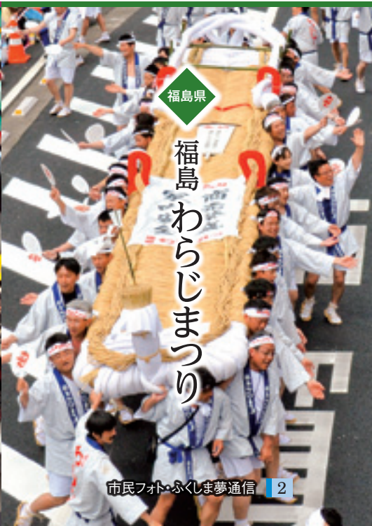
福島県 福島わらじまつり