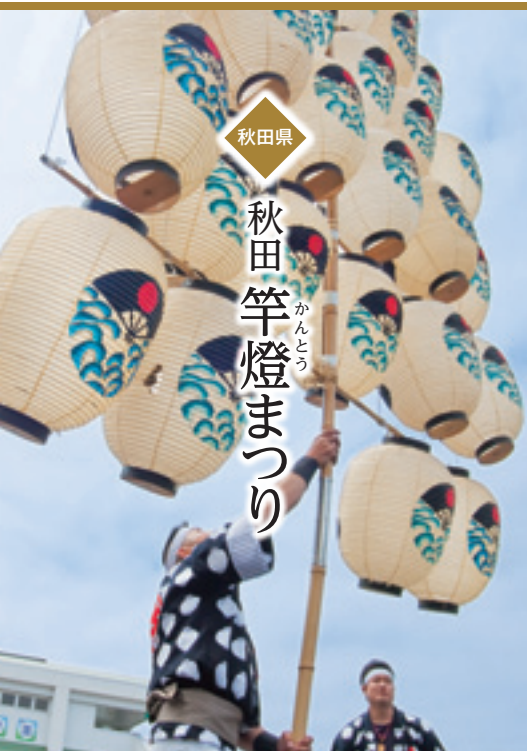
秋田県 秋田竿燈まつり