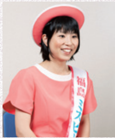
2013 ミスピーチキャンペーンクルー