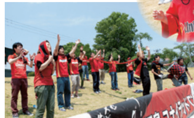
熱心なサポーターの応援が選手たちの闘争心を奮い立たせます