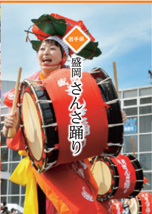
岩手県 盛岡さんさ踊り