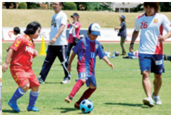
選手も楽しみにしているサッカー教室。未来のスター選手育成のために、楽しい中にも指導に熱がこもります