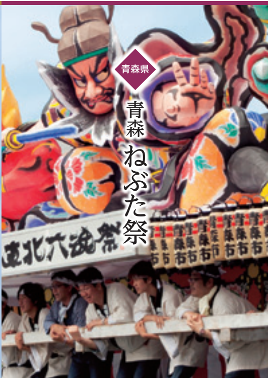
青森県 青森ねぶた祭