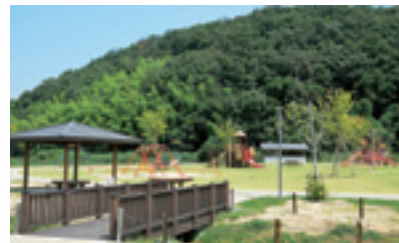
芝生広場や子供用遊具を整備

宮畑遺跡(平成15年8月 国史跡指定)では、縄文時代の90cmの柱を使った掘立柱建物や土屋根の竪穴住居跡が見つかっています。