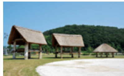
ほったてしら掘立柱建物(復元)