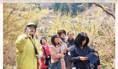
観光ボランティアガイド「ふくしま案内人」が常駐し、花見山の見どころや名所を紹介しています。同行案内をご希望の方は事前にご予約ください。

場所/福島市渡利 見頃/4月上旬～下旬 入場料/無料 アクセス/ ●JR福島駅東口から福島交通バス(渡利南回り)「花見山入口」下車、徒歩約25分 ※4月4～29日は臨時バス「花見山号」が便利です。 ●東北自動車道福島西ICから車で約30分 ※4月4～29日は交通規制あり。詳しくは裏表紙参照。