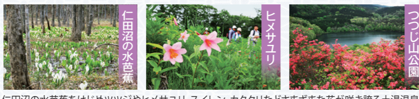
仁田沼の水芭蕉 はじめツツジやヒメサユリ、スイレン、カタクリなどさまざまな花が咲き誇る土湯温泉。

朝食できれいになる 各旅館オリジナルのからだにやさしくキレイになれる朝食をご用意しました。