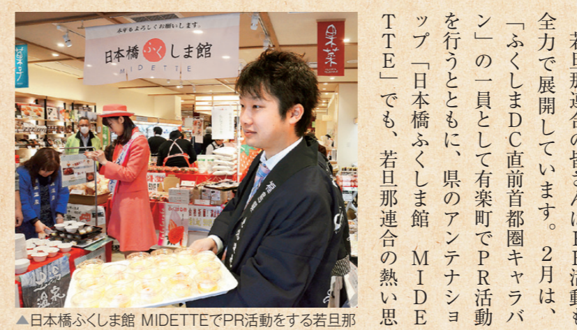
▲日本橋ふくしま館 MIDETTEでPR活動をする若旦那

「若旦那に会える 若旦那カフェ」 次世代を担う若旦那たちは、フレッシュなイケメン揃い。現在、着々と準備を進めているのが4月4日オープン予定の「若旦那カフェ」です。ふくしまDC期間中、JR福島駅東口前「中合」内に常設される カフェは、3温泉地のアンテナショップ的な役割を担うもの。湯巡りマップやお花見情報を提供したり、若旦那グッズや各温泉地の特産物を販売するコーナー(予定)、日替わりで若旦那がおもてなしをするカフェスペースを備えています。