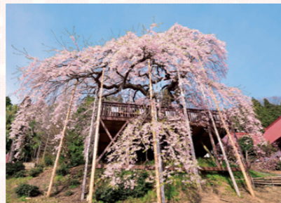
▲地元の人が開花を自安に苗代に種を蒔いたことから「種まき桜」と言われている