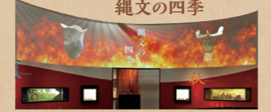
120度のスクリーン 縄文時代にもあった福島の四季を映像化。