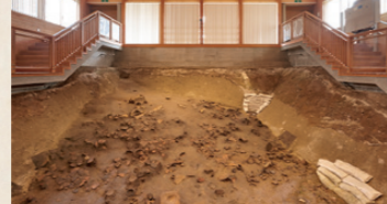
発掘調査で発見された本物の土器をそのまま展示。なぜ、まだ使える土器がたくさん発見されたのだろうか？