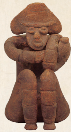
しゃがむ土偶 (国指定重要文化財・上岡遺跡出土) 土偶に込められた縄文人の心。 「座産」か「祈り」か？

「じょーもびあ宮畑(宮畑遺跡史跡公園)」は、平成15年に国史跡に指定された今から約4500年前の縄文時代の遺跡を整備した公園です。この公園では巨大な掘立柱建物や竪穴住居などを発見された場所の真上に復元し、当時の「暮らし」を再現しています。また、8月にオープンした体験学習施設では多くの出土品を展示しています。じょーもびあ宮畑で縄文の謎に触れ、ロマンを感じてみてはいかがでしょうか。