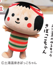
土湯温泉きぼこちゃん

昭和22年生まれ。24歳の時に、こけし工人の実兄に師事。こけしを福島の伝統工芸品の一つとして広く認知される活動をしている。