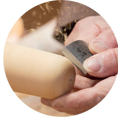
▲ろくろを回転させ、手作りの専用道具で一つつ削りあげていく

こけしは、鉢や盆などの木製の生活用品を作る木地師がろくろを挽いて作り始めた木の人形のことです。湯治客が子どものお土産にと買い求め、各地に広まっていったのだそ