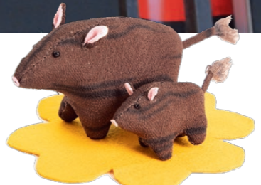
2019年の千支「亥」のつるし雛

飯野つるし雛まつりマスコットキャラクター ひなぼん 町を元気に、みんなを元気にする不思議な力を持っている、つるし雛の妖精。頭の三角は飯野町のシンボル「千貫森」をイメージ。期間中、参加店舗には必ずひなぼんが飾られています。