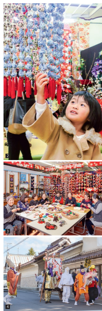
1 住民手作りの1万点を超える色とりどりのつるし雛が町中心部の商店や飲食店、公共施設など40数カ所に飾られます。中には、子どもたちの作品も 2 第11回飯野つるし雛まつりフォトコンテスト最優秀賞の作品 3 つるし雛を作る団体サークル「和楽」の皆さん。定期的に集まり情報交換をしています 4 10周年を記念して行われた有志による七福神行列。要望に応じて今年復活する予定。期間中1日1回(午後1時頃)五寶銭を配りながらメインストリートを通り歩きます

子どもの健やかな成長と幸せを願う3世代で訪れる家族も 今ではすっかり早春の風物詩となった飯野つるし雛まつり。その魅力を齋藤さんは、「やはりたくさんさんの団体が関わっていることでしょう」と話します。つるし雛を作る団体は6団体あり、催事が終わるとすぐ次の年の準備を始めるのだそう。「年々、お客さんの目が肥えてくるのでいろいろと趣向を凝らしながら作っているようです」。期間中、町内に4カ所