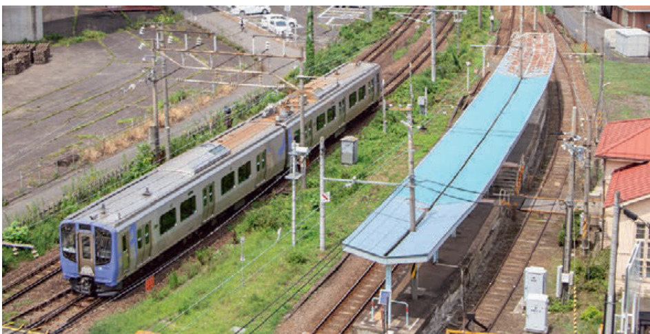
曾根田付近を走るAB900系

「杜の都」仙台に生い茂る青葉をイメージ。沿線の 山々や川と調和しながらも、都会的な印象を生む