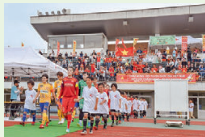
▲声援を受けながら競技場へ入場する選手たち