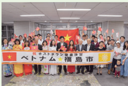
▲登録決定を喜び関係者たち

東京オリンピック・パラリンピック競技大会 福島市推進室 ☎024-563-5660