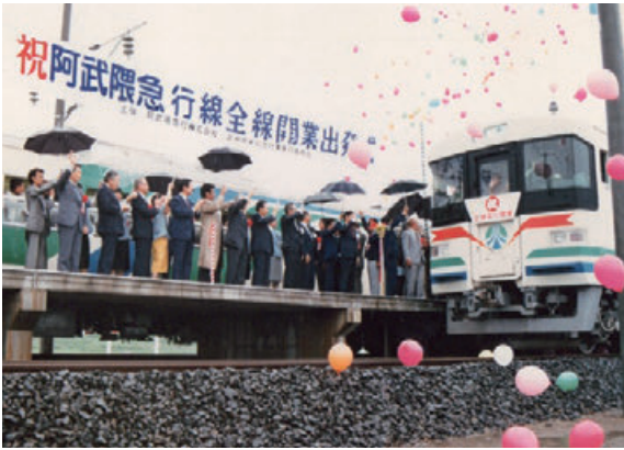
昭和63年 阿武隈急行線全線開業開通式（梁川駅）