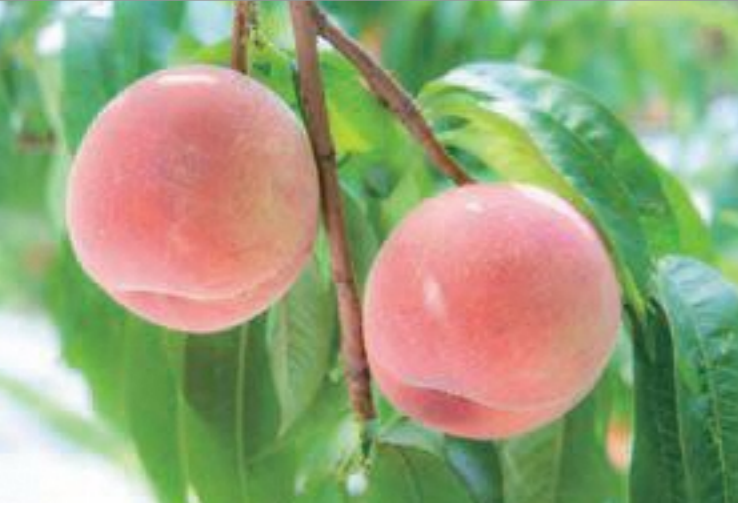
福島のモモは太陽の光をたっぷり浴びた真っ赤な見た目と糖度の高さが特徴。多彩な品種があるので食べ比べるという楽しみもある