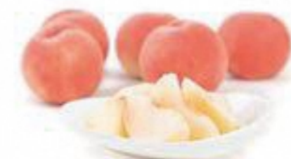
第16回 インタビュー

昭和54年福島市生まれ。仙台の大学で現代音楽を専攻。卒業後、同市内のテレビ局に勤務しながら音楽活動を続ける。並行して知人の飲食店立ち上げに関わったことから「音楽」と「食」をライフワークに。東日本大震災を機に拠点を福島市に移す。まちづくりNPOの事務局を経て平成28年に起業、代表取締役に就任。