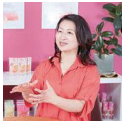
株式会社ももがある 代表取締役