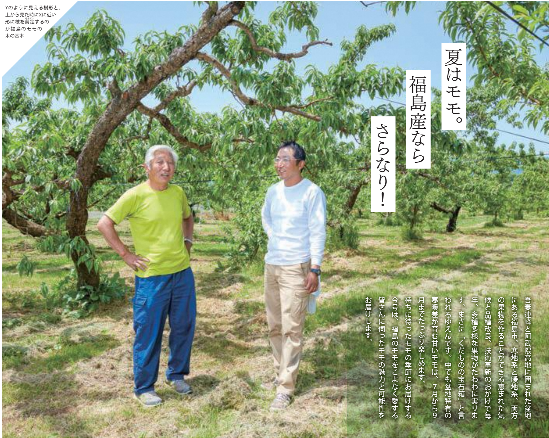
Yのように見える樹形と、上から見た時にXに近い形に枝を剪定するのが福島のモモの木の基本

吾妻連峰と阿武隈高地に囲まれた盆地にある福島市。寒地系と暖地系、両方の果物を作ることができる恵まれた気候と品種改良、技術革新のおかげで毎年、多種多様な果物がたわわに実ります。まさに「くくだものの宝石箱」と言われるゆえんです。中でも盆地特有の寒暖差が育む甘いモモは、7月から9月までたっぷり楽しめます。待ちに待ったモモの季節にお届けする今号は、福島のモモをこよなく愛する皆さんに伺ったモモの魅力と可能性をお届けします。