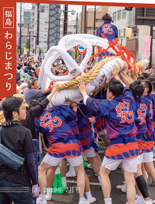
福島 わらじまつり

青森ねぶた祭 // 秋田竿燈まつり // 盛岡さんさ踊り // 山形花笠まつり // 仙台七夕まつり // 福島わらじまつり