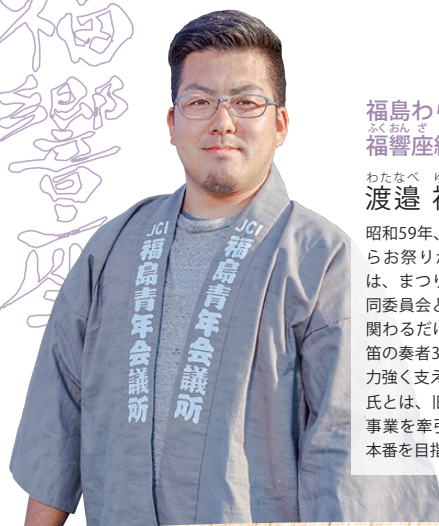
福島わらじまつり実行委員会 福響座組 座長