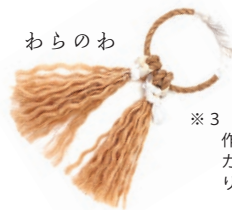
※3 「わらのわ」は、わらで作った小道具です。各人がカラフルに飾りをつけて踊りを華やかにしています。