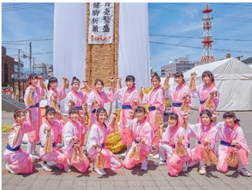
新しいわらじおどりを披露した橘高校ダンス部のメンバー