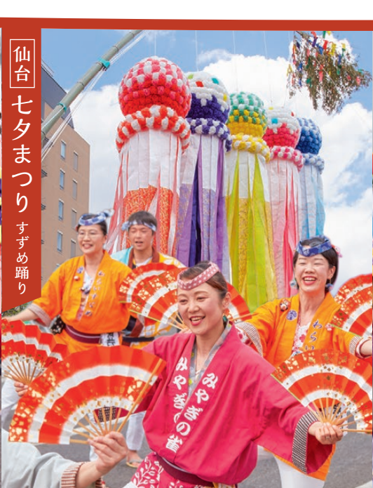
仙台 七夕まつり すずめ踊り