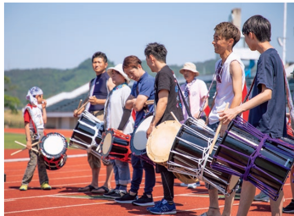
「福響座組」は、福島市内の町会から集まった小学生から大人まで総勢133名のメンバーです。今年3月から始まったゼロから作り上げるというチャレンジ精神の塊のような練習は、参加者の距離を縮めました