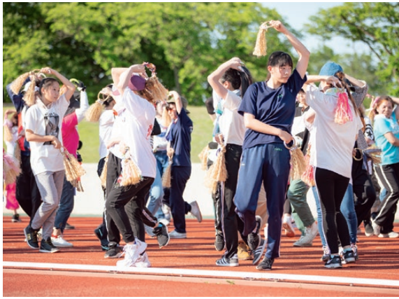
「舞座組」は、わらじまつりに参加していた福島市内のダンス教室や高校のダンス部の協力により誕生。子どもから大人まで総勢160人で、今年4月から練習を開始しました