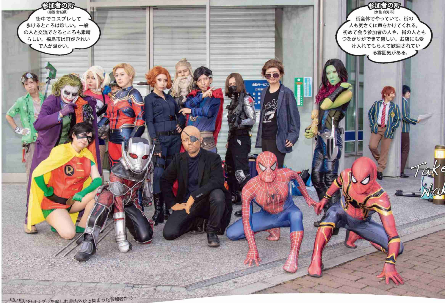
思い思いのコスプレを楽しむ県内外から集まった参加者たち

参加者の声 (女性 白河市) 街全体でやっていて、街の人も気さくに声をかけてくれる。初めて会う参加者の人や、街の人ともつながりができて楽しい。お店にも受け入れてもらえて歓迎されている雰囲気がある。