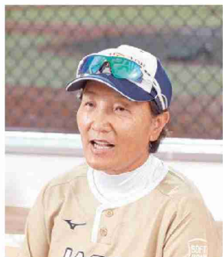
ソフトボール女子日本代表監督 宇津木麗華さん

1/宇津木スタジアムの愛称で親しまれている高崎市ソフトボール場に立つ宇津木麗華監督 2/十六沼公園体育館で行われたボッチャ地区対抗交流大会でパラリンピック国内開催に期待する増子恵美さん