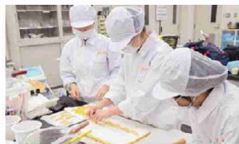
▲考案したレシピを実際に生徒が調理