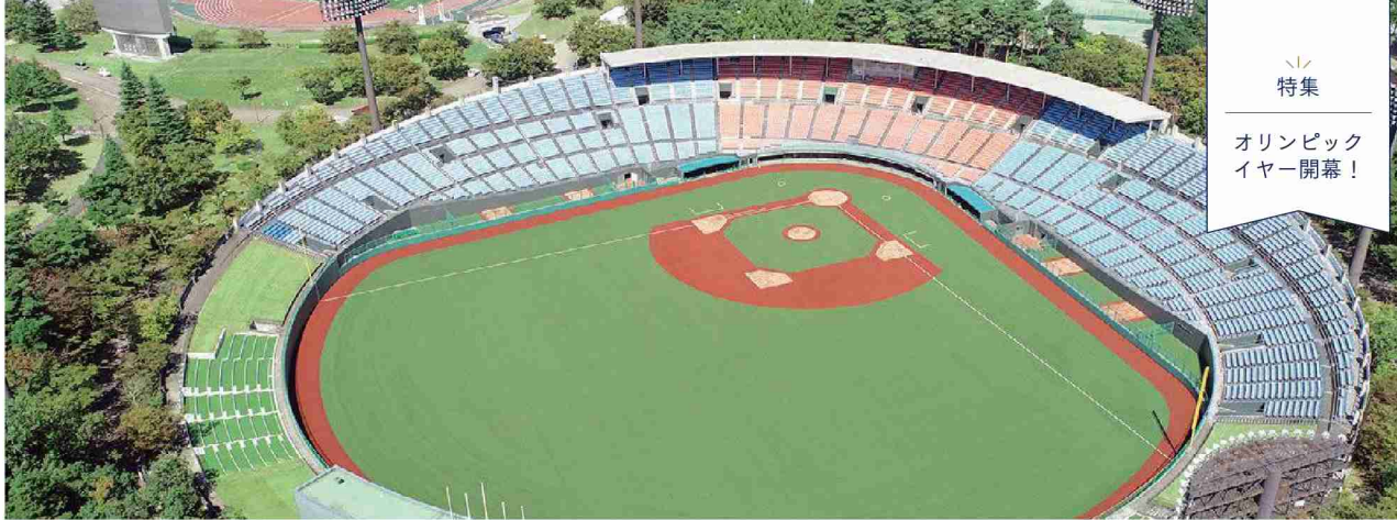
東京2020オリンピック野球・ソフトボール競技の開催を待つ「福島県営あづま球場」