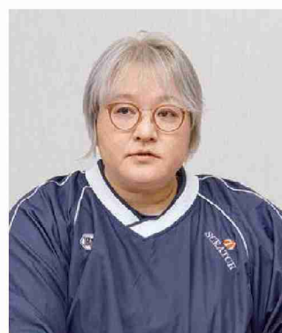
元車いすバスケットボール日本代表