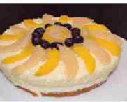
とムースケーキ(右)には福島産の「モモ」と「リンゴ」を使用