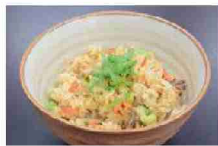
明成高校で育てたお米で作ったおこわ

ベトナムの主食「フォー」の原料である米・米粉をベースにレシピを考案!また、東京2020大会期間中に収穫できるモモをメインに福島の特産品である「くだもの」を食材に積極的に取り入れながら、ベトナムの人々が大切にしている「五味・五彩・二香」の精神をコンセプトの1つとして取り組んだレシピたちです。