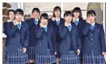
▲明成高校プロジェクトチームのメンバー