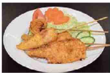
オクラと豚肉の榮養たっぷり串カツ