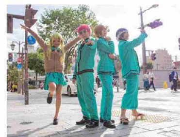
お気に入りのキャラクターに扮する参加者

参加者の声 (女性 白河市) 街全体でやっていて、街の人も気さくに声をかけてくれる。初めて会う参加者の人や、街の人ともつながりができて楽しい。お店にも受け入れてもらえて歓迎されている雰囲気がある。