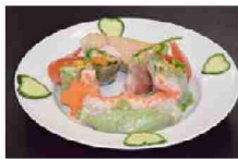
ベトナム料理の生春巻きにも明成高校産の野菜をふんだんに使用