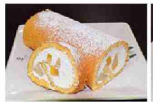
米粉ロールケーキ(左)