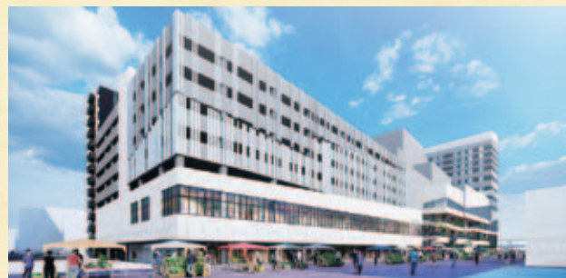
2026年完成予定の福島駅前交流・集客拠点施設

As a dignified prefectural capital, we will work to create a vibrant and dynamic city by concentrating and strengthening advanced urban functions.