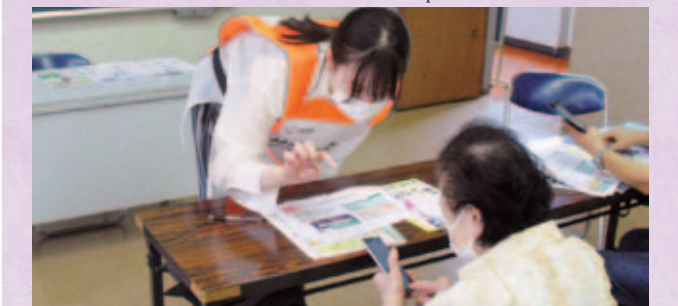
高齢者向けスマートフォン利活用支援講座。 市民共創で高齢者にもやさしいデジタル化を推進

We will review, improve, and enhance services without being bound by precedents such as the use of ICT, in order to achieve the maximum effect with the minimum expense.