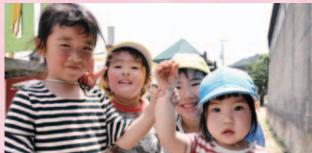
待機児童ゼロを維持しながら子育てを全力サポート

In order to achieve sustainable development despite a declining population, we will create a town as chosen by the child-rearing generation through in-depth support.