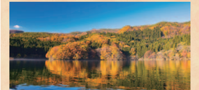
先人から受け継いだ文化や環境を次世代へ

We will cherish Fukushima's unique culture and rich environment, and pass them on to the next generation while working on new developmental efforts.