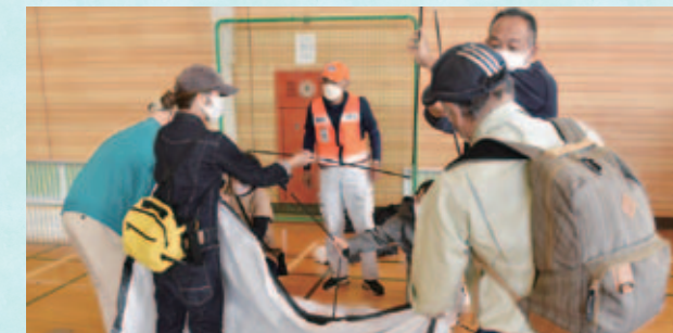
地域の防災力アップのため多種多様な防災訓練を実施

We will promote disaster prevention and mitigation measures, radiation countermeasures, the elimination of harmful rumors, and countermeasures against infectious diseases to create a healthy, safe, and comfortable city for everyone to live in.