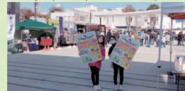
企画から運営まで市民との共創で街なか活性化イベントを実施

While codeveloping with citizens, we will take on the challenge of implementing advanced policies that are uniquely Fukushima, and communicate our image as a prefectural capital to the rest of the country and the world.