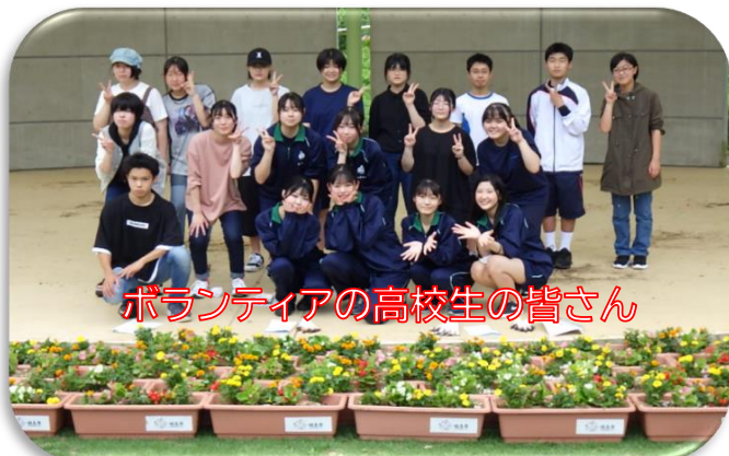
ボランティアの高校生の皆さん