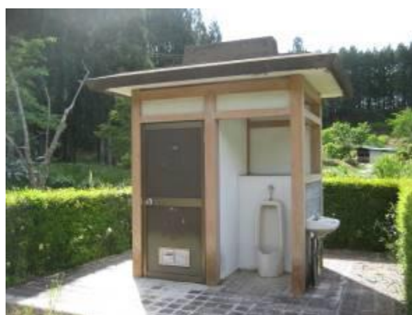
トイレ（立子山農村広場）