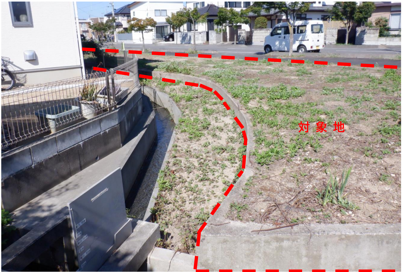
D:南東側から北西側方向