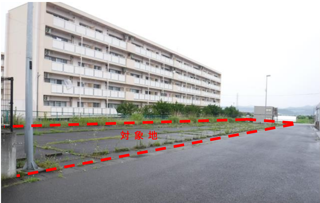
B：東側から西側方向