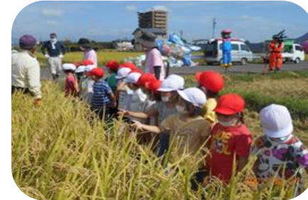
児童の稲刈り体験