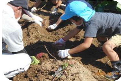
児童のサツマイモ堀体験