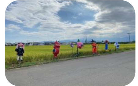
園児制作かかしコンクール