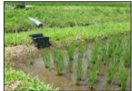
田んぼダムに取組む圃場の様子