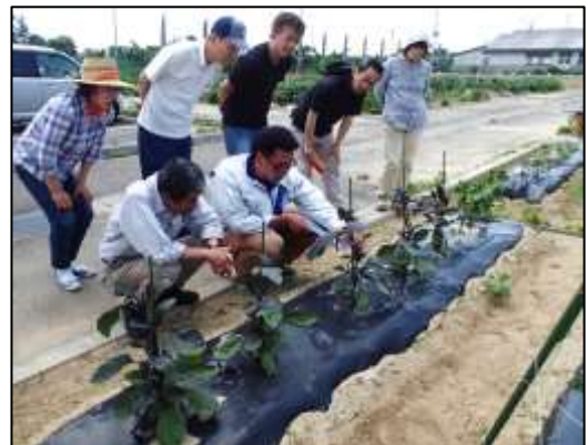
市民農園での現地指導の様子