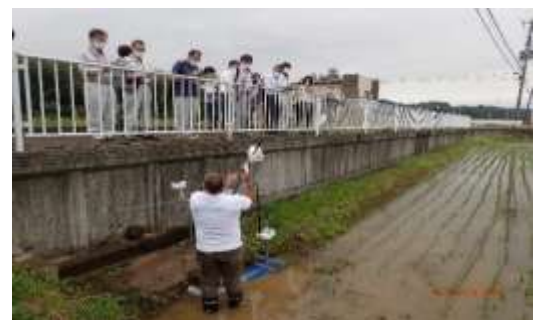
水位センサについて説明を聞く参加者