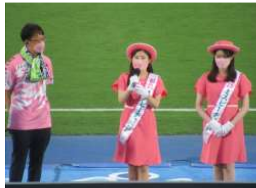
フィールド上でのPR