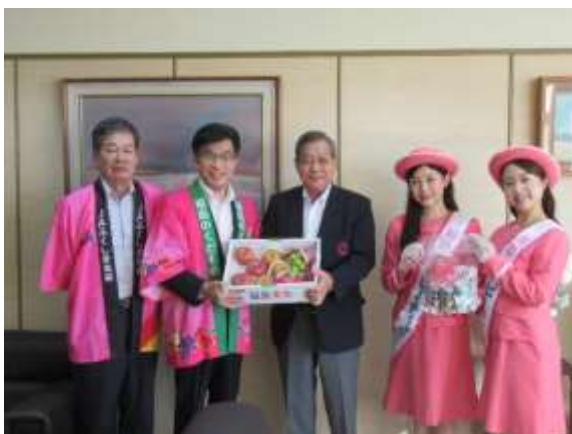
阪神地区でのトップセールス

首都圏、阪神地区などで福島産くだもの魅力を広くPRすることにより、消費拡大を図りました。