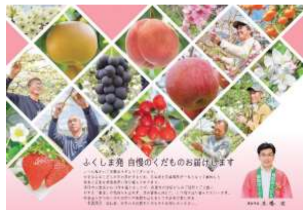
2022 市長メッセージチラシ