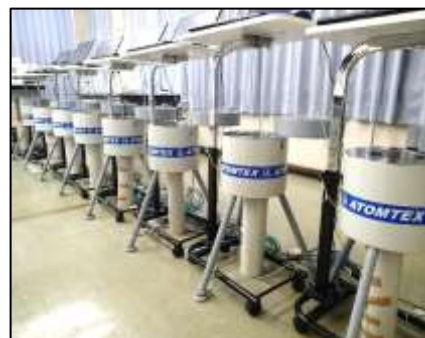
モニタリング検査機器