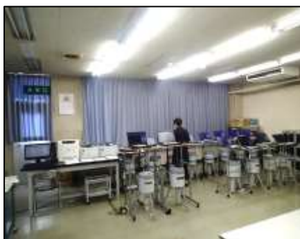
モニタリングセンター