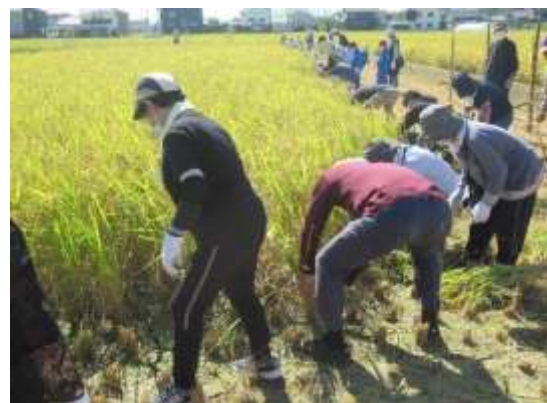
稲刈り体験の様子