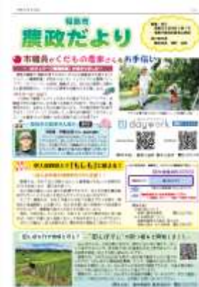
【農政だより 令和4年9月号】