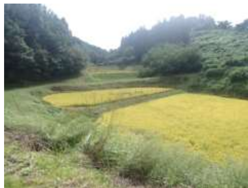
中山間地域直接支払交付金事業の対象圃場