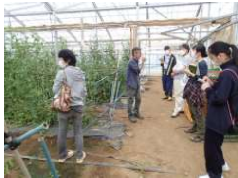
週末ファーマー体験講座の様子