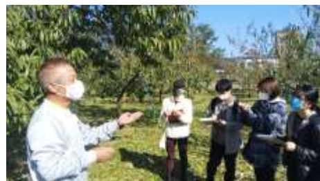
モモ農家へのヒアリング

学生に対する福島市の農業・食産業の理解促進と、地元産業への人材定着を促し、本市農業に資することを目的に、フィールド実習を重視した実践型の教育プログラム（令和元年度から6カ年）の実施を福島大学食農学類に委託しました。