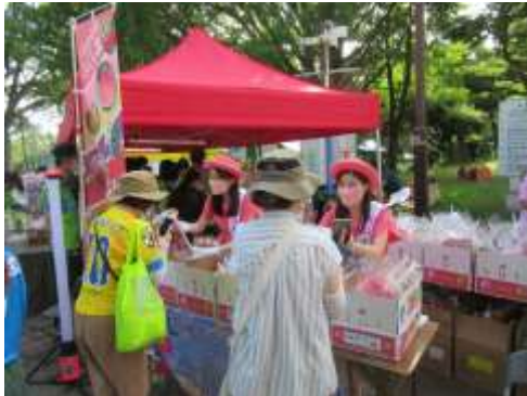
来場者へモモを配布する様子