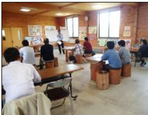
栽培講習会の講義の様子