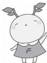
福島大学公式マスコット キャラクター めばえちゃん

〈問合せ先〉 市…農業企画課 農業被害対策係 電話(525)3727 県…県北地方振興局 県民生活課 電話(521)2709