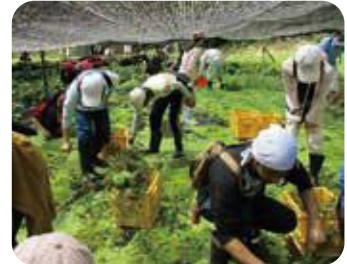
田の中に入って草取り体験