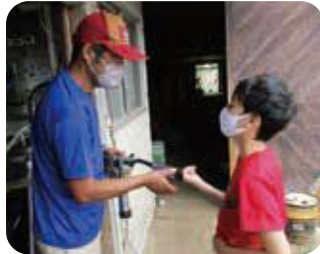
搾乳器に指を入れて、搾乳の動きを体験