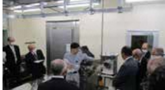
ジビエ食肉処理加工等施設で説明に聞き入る