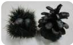
炭化器で作った「飾り炭」