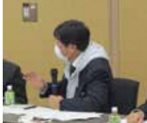
熱心に質問する委員

5年ぶりの視察研修会を実施、中間管理事業を活用した集積・集約、目標地図素案作成の今後や、有害鳥獣対策について意見交換を行いました。