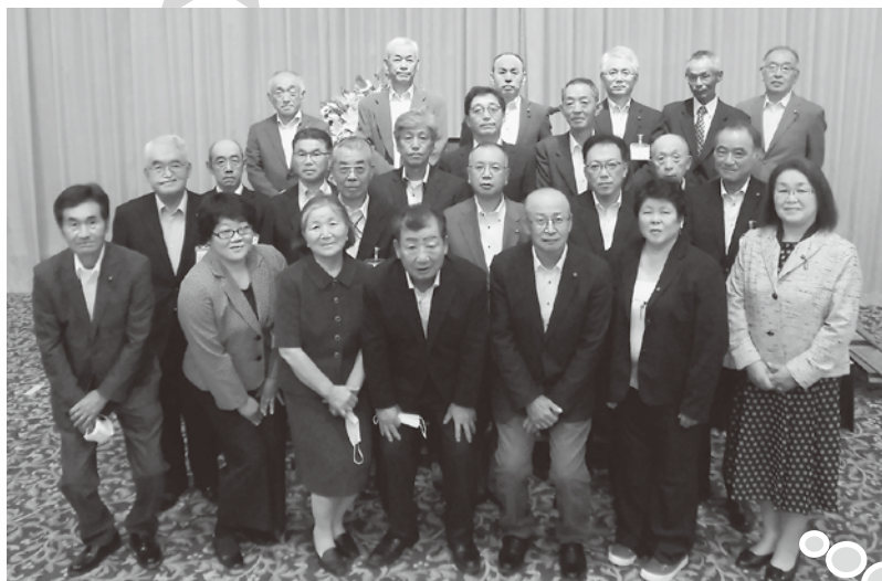
農業委員の皆さん