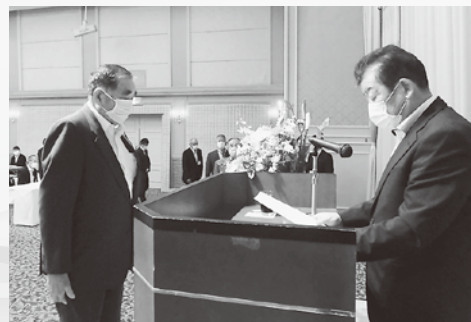
会長より委嘱状を受ける農地利用最適化推進委員

身に余る光栄でありますと共に、その職責の重さを痛感している次第であります。農業委員会は、地域の期待に応え、地域農業の復興・発展を目指し、農業者の皆さんと一体となり取り組まなければならないと考えております。どうぞ皆様のご理解と更なるご支援をお願い申し上げます。就任のあいさつといたします。