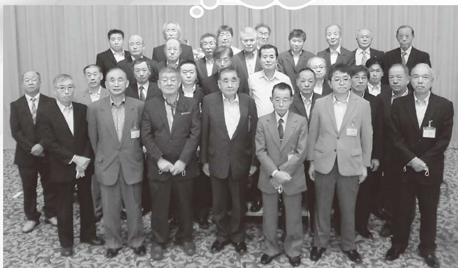
農地利用最適化推進委員の皆さん

制がスタートいたしました。農業委員会では、地域における農業委員及び推進委員の活動により、農地転用許可などの農地の利用関係の調整や担い手への農地利用の集積・遊休農地の発生防止解消・新規就農の促進の農地等利用の最適化に組織一丸となって取り組んでいます。就農者の高齢化・