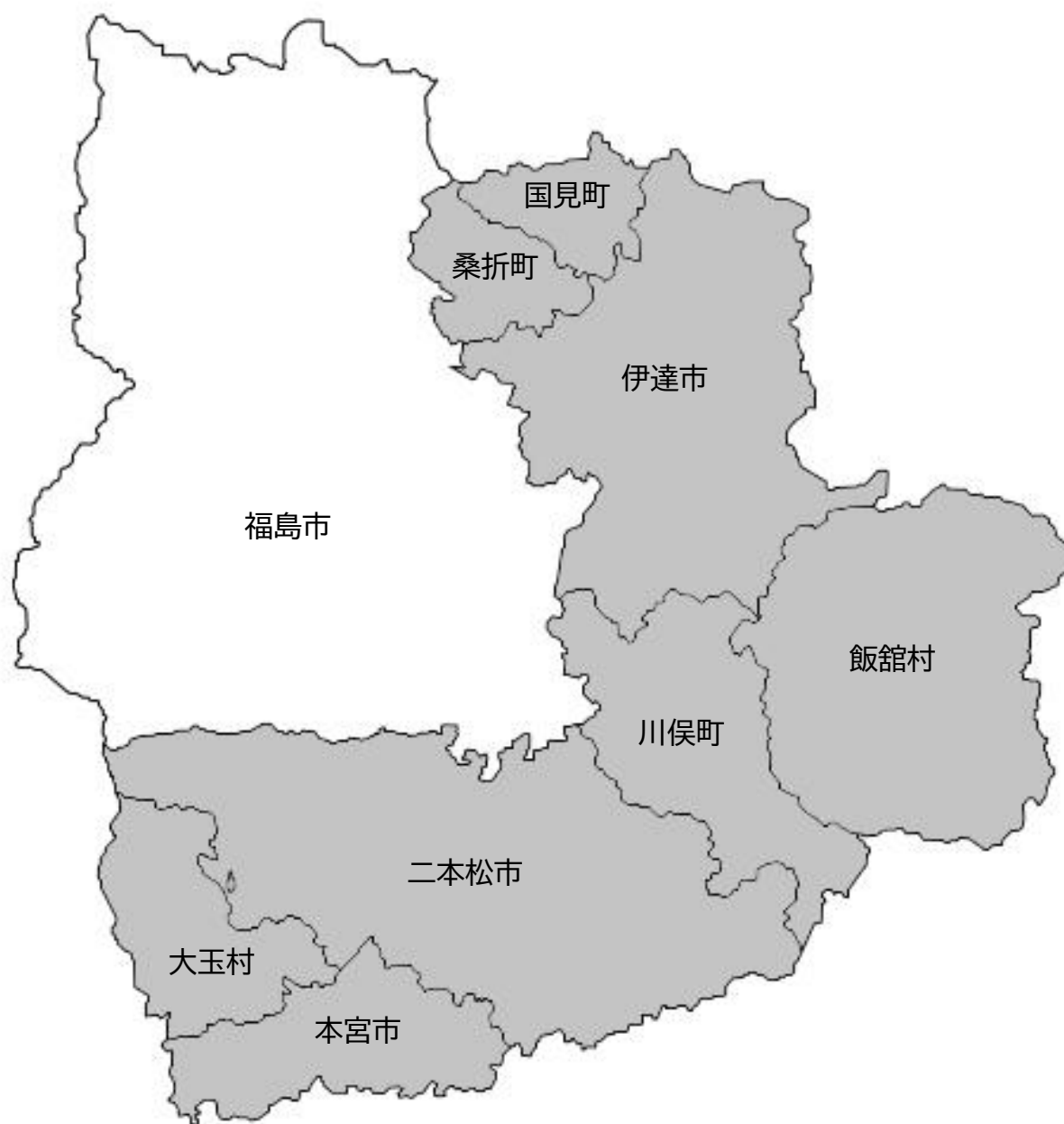
【本市との連携が想定される市町村】

二本松市、伊達市、本宮市、桑折町、国見町、川俣町、大玉村、飯館村 (計3市3町2村)