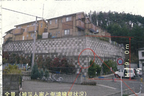
全景 (被災人家と倒壊擁壁状況)