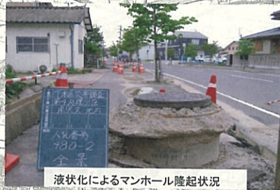
液状化によるマンホール隆起状況