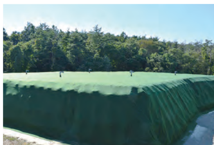
〈参考〉仮置場での除去土壌(土のう)の保管状況