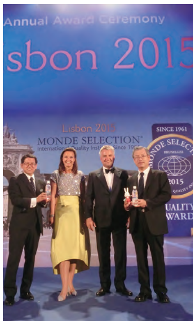
㉒ペットボトル「ふくしまの水」がモンドセレクション金賞授賞