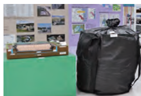
【除染等の道具展示】