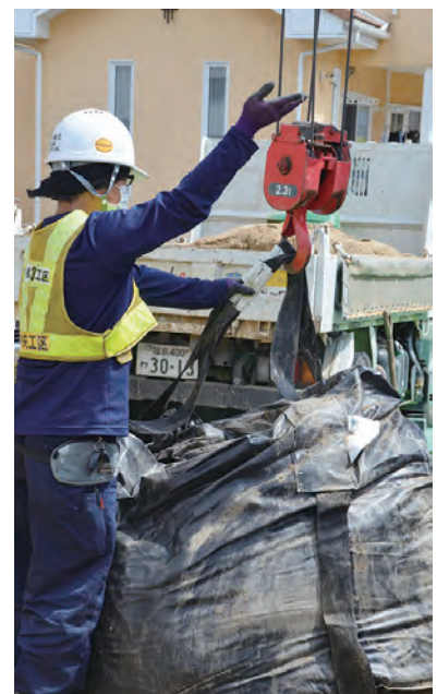
〈参考〉住宅内に現場保管していた除去土壌搬出