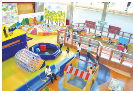
⑲市民会館内に屋内遊び場「さんどパーク」オープン