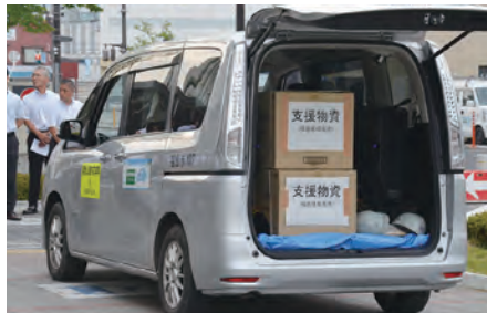
㉐平成30年7月豪雨にて被災した倉敷市へ災害派遣