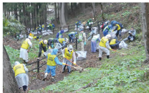
⑰渡利弁天山でボランティアによる除染活動