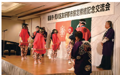
⑩東京都荒川区と友好都市協定を締結