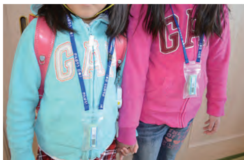
⑨個人積算線量計(ガラスバッジ)を配布

用語解説 Bq ベクレル 1秒間に放射線を出す放射性物質が何個あるかを表している