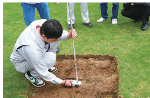
〈参考〉公園の環境放射線量低減対策実験(新浜公園)