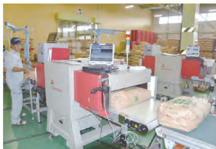
⑱米の全量全袋検査開始