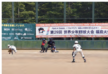
④②第29回世界少年野球大会福島大会開幕