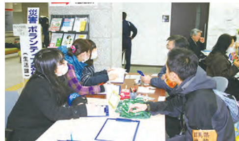
④災害ボランティアセンター開設