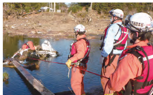
〈参考〉 福島市消防本部による 県内広域応援隊活動