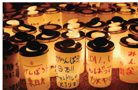
⑫ふくしまキャンドルナイト2011