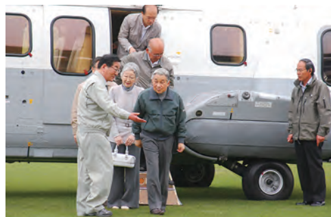
◎天皇皇后両陛下があづま総合体育館をご訪問