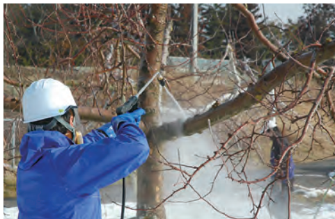
⑬果樹園地の除染作業

・ 市独自で導入した移動式ホールボディカウンタ車による内部被ばく検査を大波小学校から開始(写真⑮)