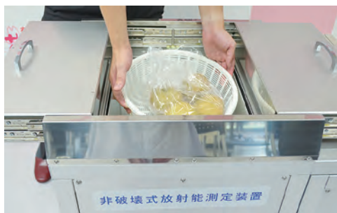
⑯非破壊式放射能測定装置