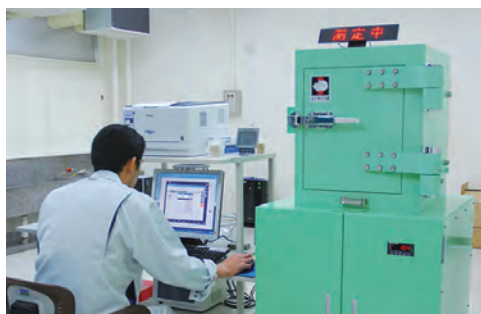
⑪放射線モニタリングセンター開所(食品等の放射能測定開始)