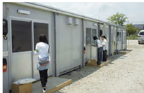
〈参考〉 応急仮設住宅入居開始