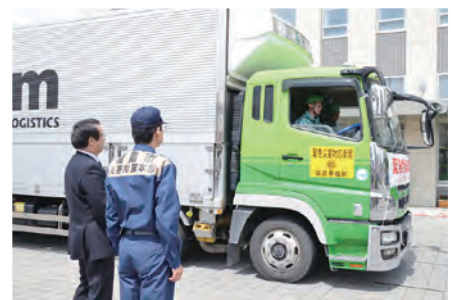
㉑熊本地震にて被災した熊本市へ緊急物資出発