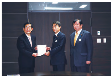
㉒根本復興大臣(当時)に要望書を提出