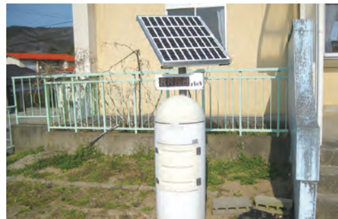
⑭リアルタイム線量測定システムの運用開始