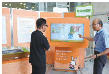
⑳福島市役所内に「除染情報センター」開設