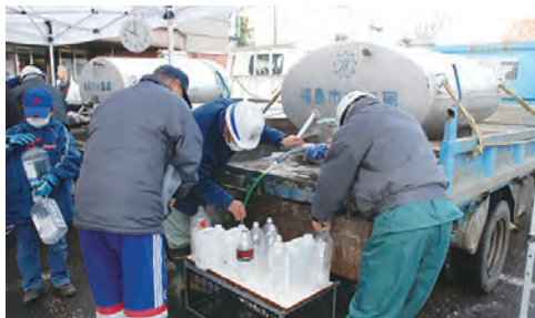
③給水車による給水活動