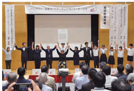
④⑤バリアフリー推進パートナー「キックオフミーティング」開催