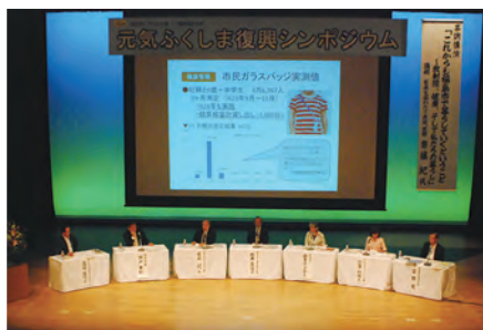
⑳「元気ふくしま復興シンポジウム」開催