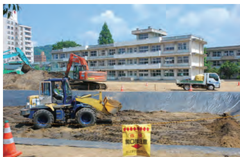
⑥学校等の校庭・園庭の表土改善事業(除染)開始