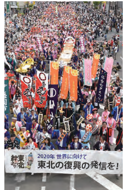
㉒「2019東北絆まつり」が福島市で開幕