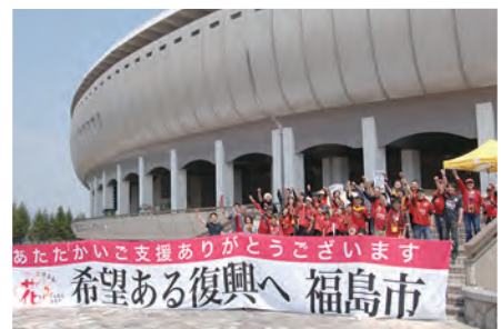
〈参考〉支援等への感謝メッセージ