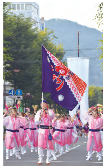
④③福島わらじまつり開幕「新わらじおどり」披露