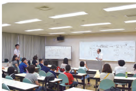
㉓放射線と市民の健康講座