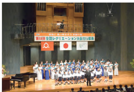
㉑第68回全国レクリエーション大会が開幕