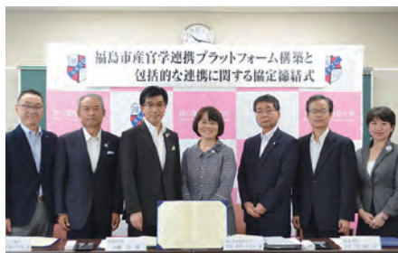
㉓「福島市産官学連携プラットフォーム構築と包括的な連携協定」を締結