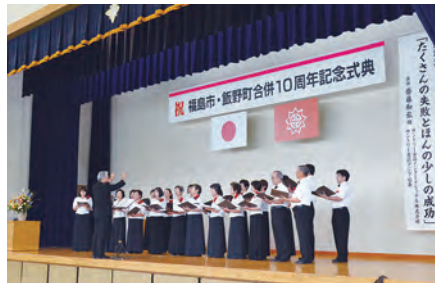
㉑福島市・飯野町合併10周年記念式典