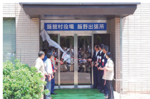
⑦飯館村役場飯野出張所開所(福島市)