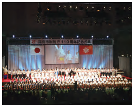
③福島市制施行110周年記念式典