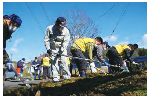
⑩大波地区の住民とボランティアによる除染活動