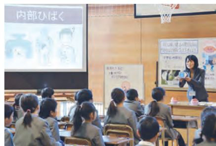
〈参考〉小学生へ放射線教育の公開授業