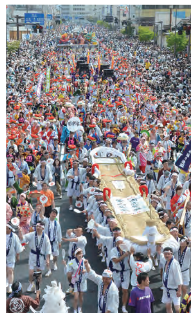
㉒東北六大祭りが共演する「東北六魂祭」が開幕