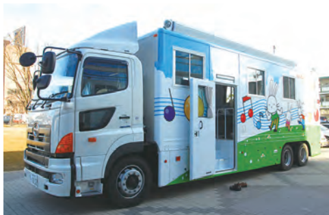
⑮市が導入した移動式ホールボディカウンタ車