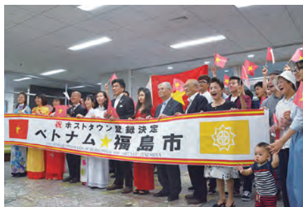
④①ベトナムとのホストタウン登録決定