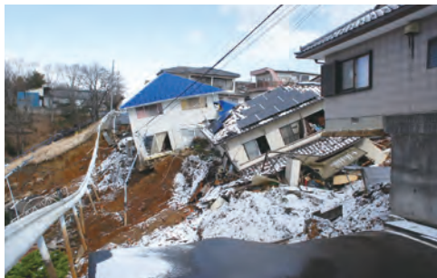
①あさひ台団地の法面崩落