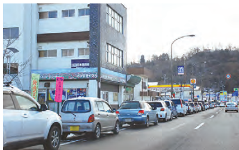
〈参考〉ガソリンを求めて並ぶ市民(渡利地区)