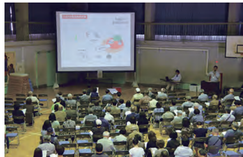
〈参考〉住宅除染の住民説明会