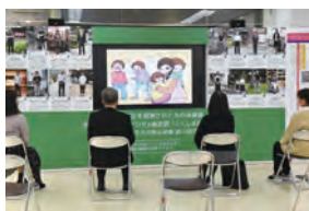
【80インチ大型モニター】