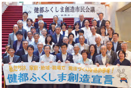
④④「健都ふくしま創造市民会議」開催