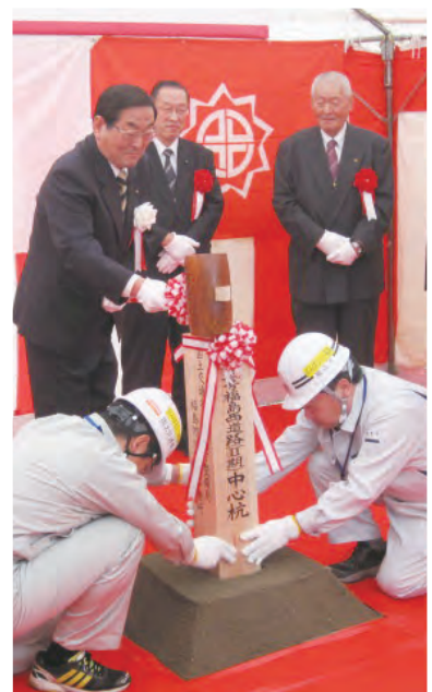
㉑福島西道路の道路中心線設置式(南伸区間)