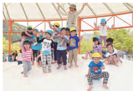
㉑十六沼公園内に「ぴよんぴよんドーム」オープン