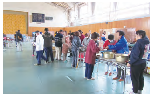
〈参考〉避難所の炊き出し