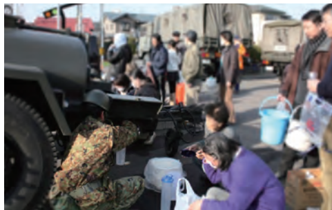
〈参考〉自衛隊による給水活動