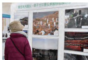
【伝承館移動展示コーナー】