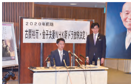
㉔古関裕而・金子夫妻を主人公とした朝の連続テレビ小説「エール」放送決定