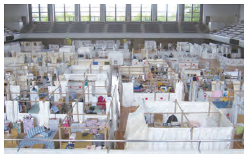
〈参考〉 福島県広域避難所(あづま総合体育館)