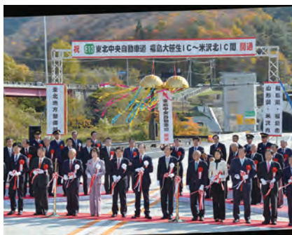
④東北中央自動車道福島大笹生IC～米沢北IC開通式