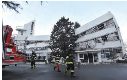
②福島学院大学本館2階座屈