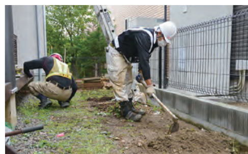
〈参考〉一般住宅の除染作業