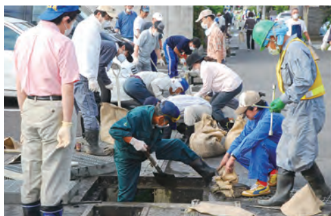
⑧渡利地区の住民とボランティアによる除染活動