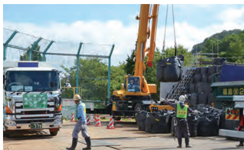
⑪中間貯蔵施設へ本格輸送開始(大波地区)