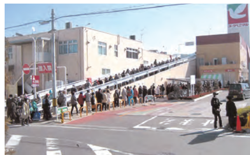
〈参考〉生活物資を求めて並ぶ市民(杉妻地区)