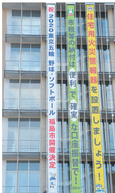
⑫東京2020オリンピック野球・ソフトボール競技福島市開催決定