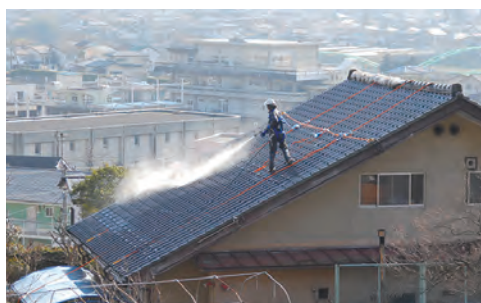
〈参考〉渡利地区住宅の除染作業(屋根洗浄)