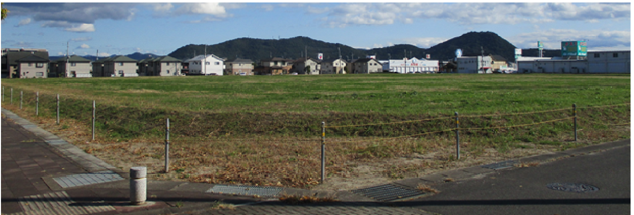
北西方面より撮影