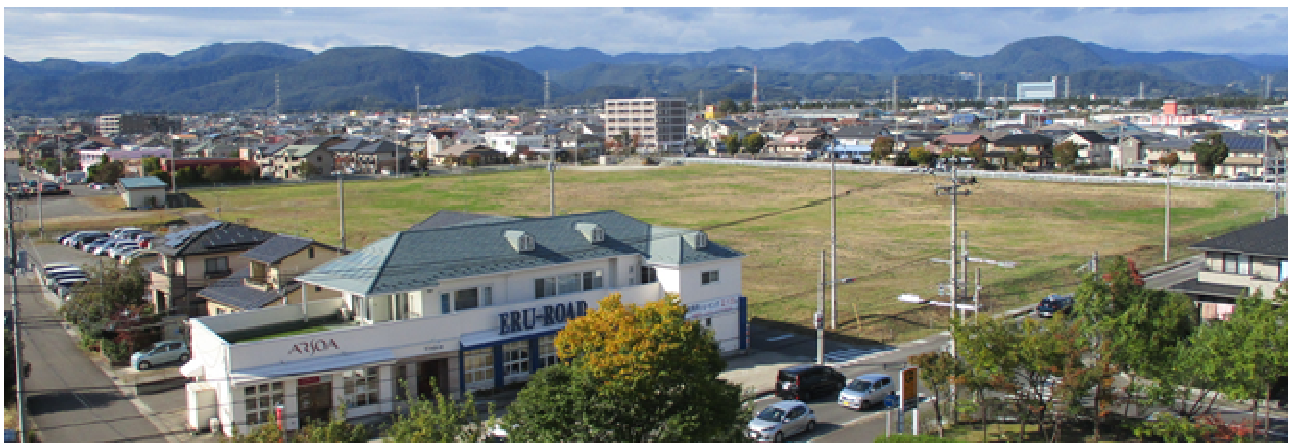
南東方面より撮影