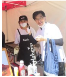
10月1日 まちなか広場 (どうゆう祭り)