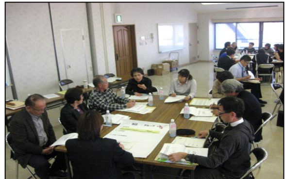
【吉井田地区懇談会の様子】