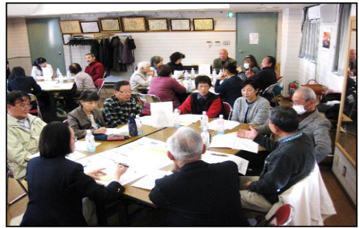
【第3方部地区懇談会の様子】

市では、令和元年10月7日から12月18日まで、26地区25会場で実施し、各地区の代表者である町内会長や民生委員・児童委員、小中学校などの父母、地域の社会福祉施設、ボランティア団体など、地域の様々な方が集まって懇談会を開催しました。