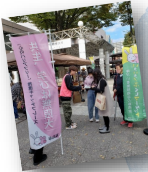
推進隊の学生が考案した 啓発チラシを直接 手渡しました♪