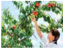
●夏の日差しで色づく果実（桃狩り）