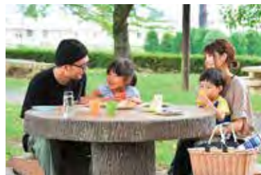
サロンは定休日なしで営業。月1回ほどの家族揃っての外出は貴重な団らんタイム