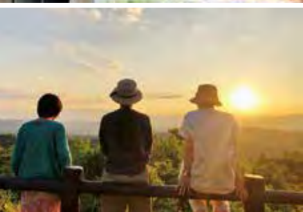
食堂スタッフのみんなと、山並みと夕陽がきれいなスポットにお出かけ。