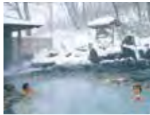
●雪見風呂（野地温泉）