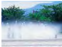
●真夏の水遊び（十六沼公園）