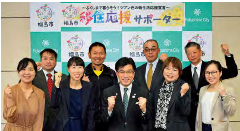
8名の移住応援サポーターが活動中!!