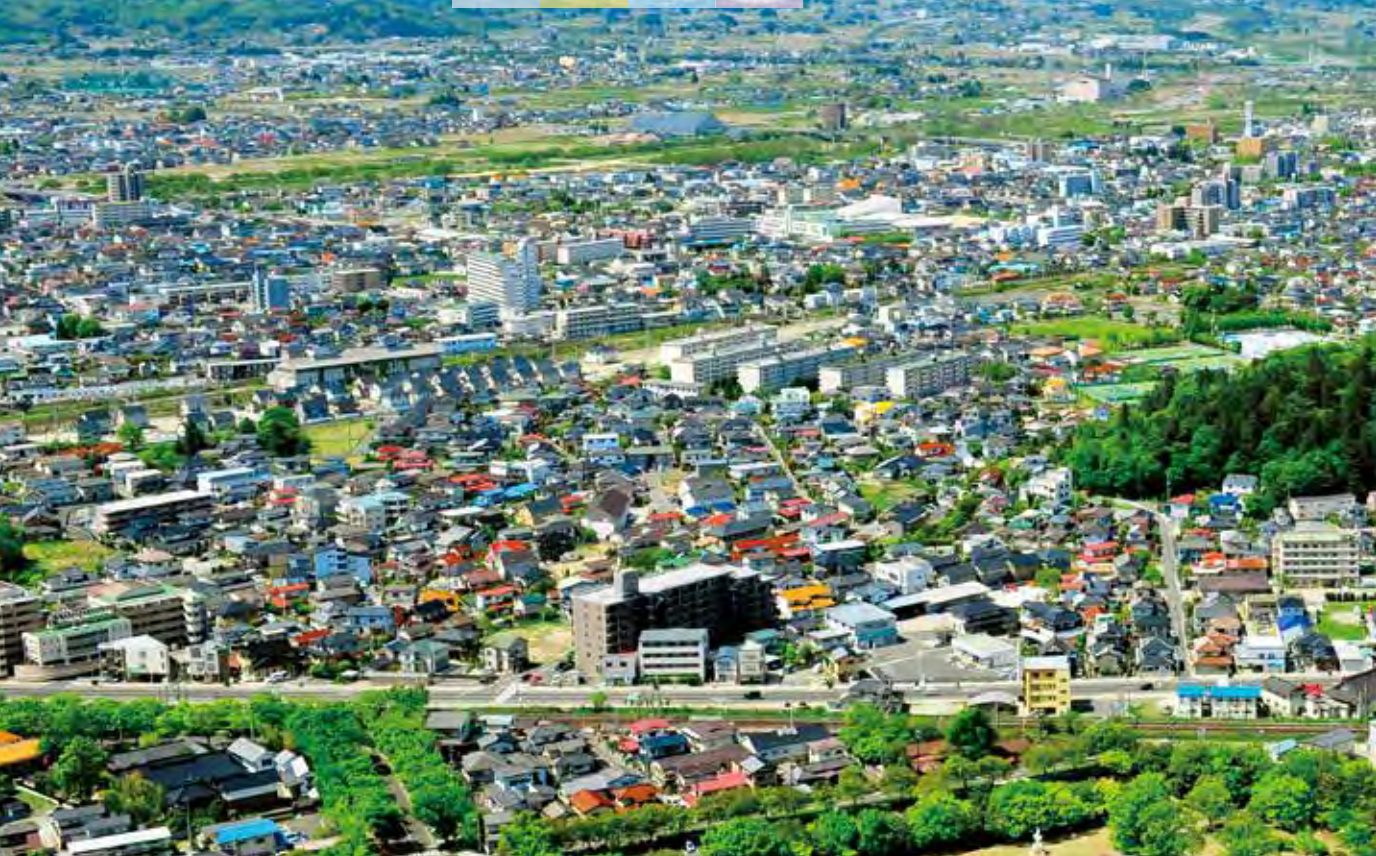
信夫山から望む福島市街地と吾妻連峰