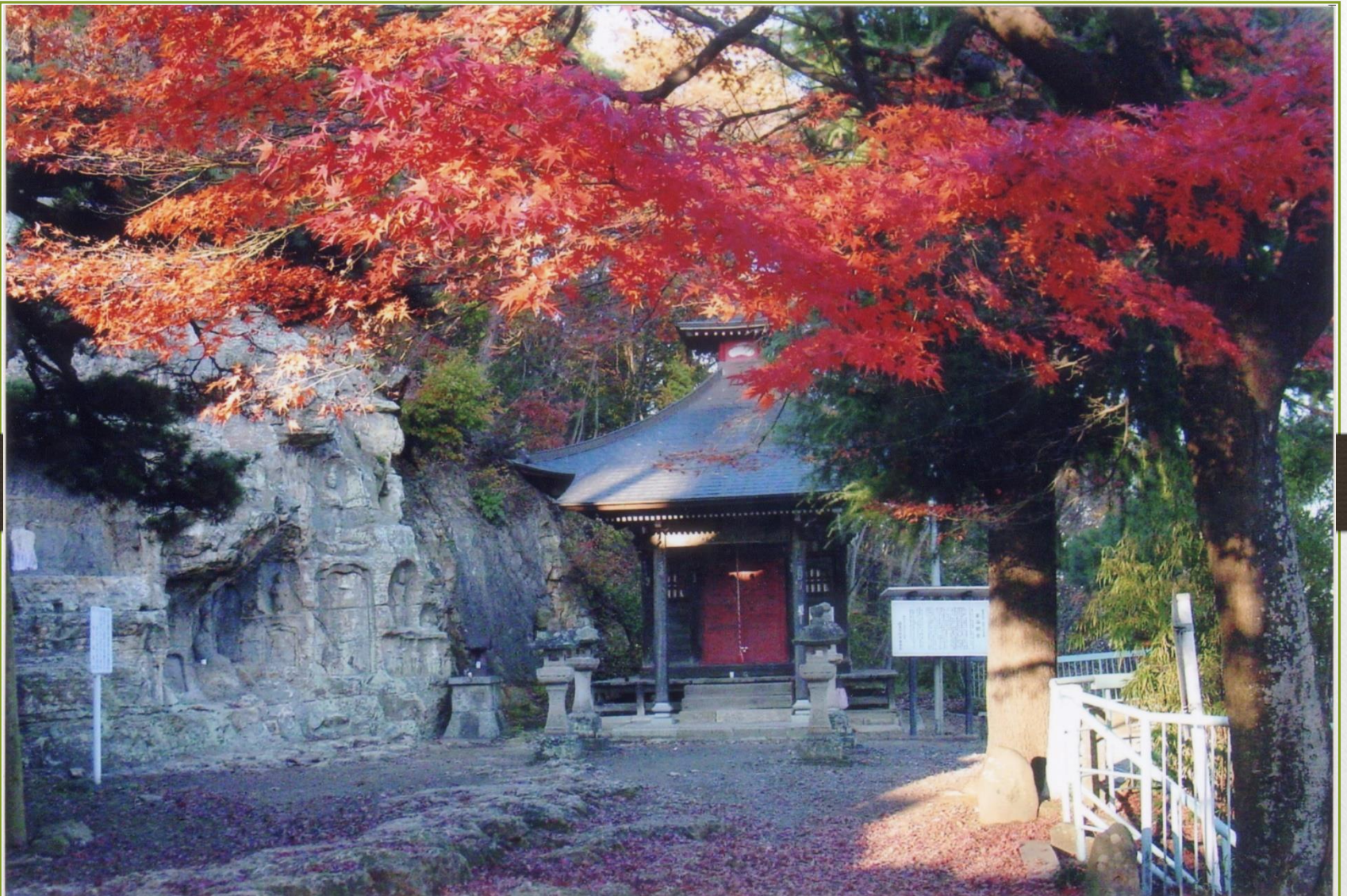
岩谷観音と周辺の自然（ふくしま市景観100選より）