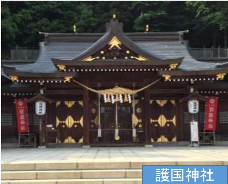
護国神社 黒沼神社