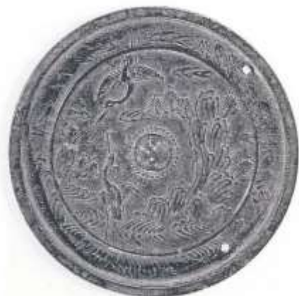
20 蓮葉鏡 (図版3-7)