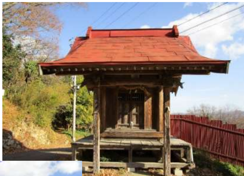
山王宮(さんのうぐう)