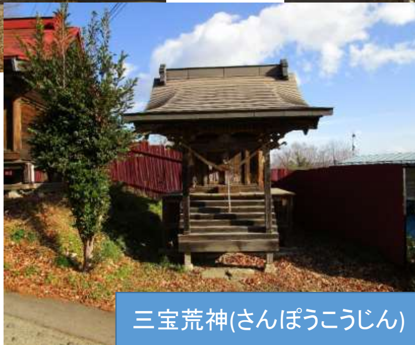
三宝荒神(さんぽうこうじん)