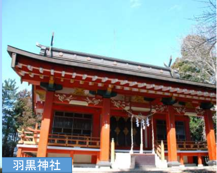
羽黒神社 月山神社