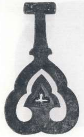
43 鏡板 (図版7-1)