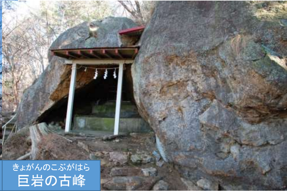
きよがんのこぶがはら 巨岩の古峰