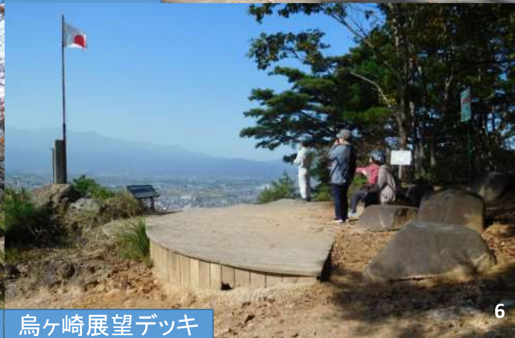
烏ヶ崎展望デッキ