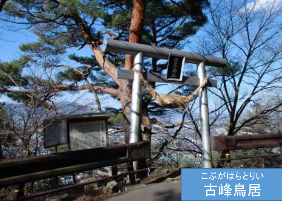
こぶがはらとりの 古峰鳥居