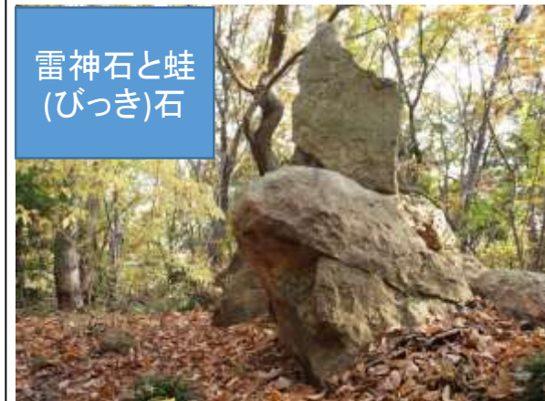
雷神石と蛙 (びっき)石